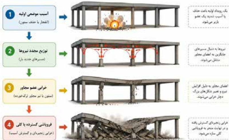
شکل ۱- فرایند کلی فروپاشی پیش‌رونده

فروپاشی پیش‌رونده یکی از پیچیده‌ترین پدیده‌های خرابی در مهندسی سازه است که در آن یک آسیب موضعی اولیه می‌تواند به گسترش زنجیره‌ای خرابی و در نهایت فروپاشی کلی سازه منجر شود.