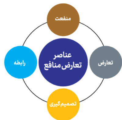
شکل ۱- عناصر تشکیل‌دهنده تعارض منافع

عناصر تشکیل‌دهنده تعارض منافع عبارت هستند از منفعت، تعارض، قضاوت (تصمیم‌گیری) و رابطه [۱]